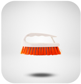
CEPILLO ERGONOMICO P/INTERIORES CERDAS RÍGIDAS, 1 PIEZA