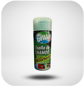
CHAMOY - TRAPO MATERIAL SINTETICO