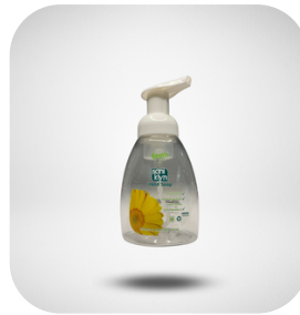
ESPUMADORA HANSOAP ENVASE Y BOMBA