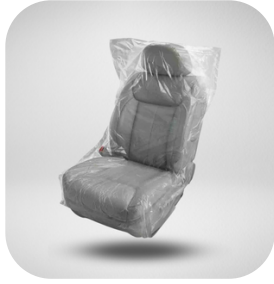
CUBRE-ASIENTOS GRANDE GRUESO ROLLO 500 Pza.