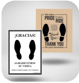
TAPETE SIN IMPRESIÓN GRANDE DE 57 X 44 1,000 PZAS