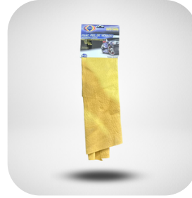
CHAMOY - TRAPO PIEL DE VENADO