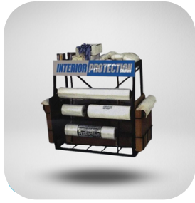
RACK PORTA ROLLO CUBREASIENTOS Y TAPETES