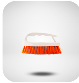
CEPILLO ERGONOMICO PARA LLANTAS, 1 PIEZA