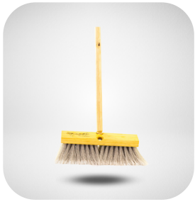
CEPILLO LARGO DE CERDAS SUAVES, 1 PIEZA