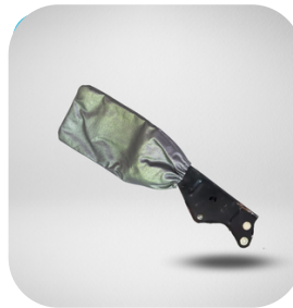
CUBRE PALANCA DE FRENO DE MANO VINIL PLATA 1 PIEZA