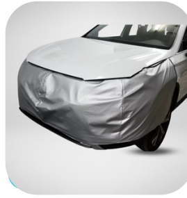
CUBREFACIAS SALPICADERAS DE VINIL