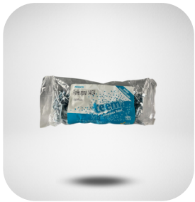
PIJAS HEXAGONAL 1/4 X 3/4 BOLSA C/ 100 PZAS.