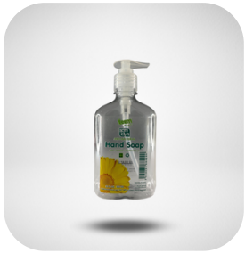
BOTE 333 ML Y HANSOAP ENVASE Y BOMBA