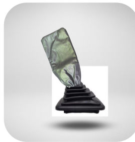
CUBRE PALANCA DE VELOCIDADES VINIL PLATA 1 PIEZA