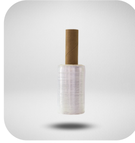
CUBRE-VOLANTE 5" X 366 M, 1 PIEZA