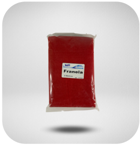
FRANELA ROLLO DE 1 MTS. BLANCO, ROJO, GRIS