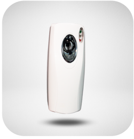
EQUIPO ELECTRICO HOME