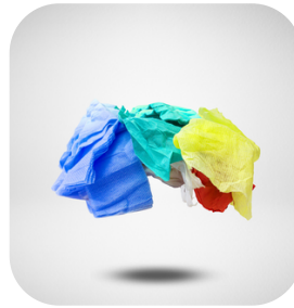
TRAPO INDUSTRIAL LIGERO BLANCO 30KG