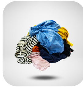
TRAPO CAMISETA 20 KG.