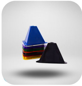
TORRES DE IDENTIFICACION (VARIOS COLORES) PIEZA