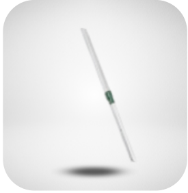
CEPILLO MANGO LARGO CERDA SUAVE TUBO EXTENSION