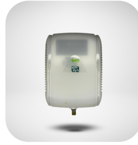
EQUIPO ELÉCTRICO GOTEADOR