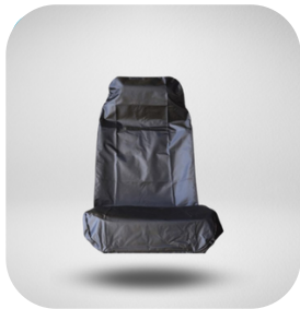
CUBRE ASIENTO VINIL PLATA 1 PIEZA