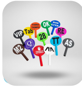
PALETAS PARA TORRES 10 COLORES