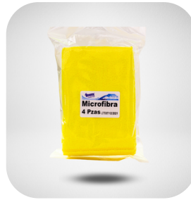
MICROFIBRA PLUS PAQ C/4 PIEZAS