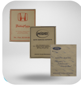
TAPETE PERSONALIZADO GRANDE DE 57 X 44 1,000 PZAS.