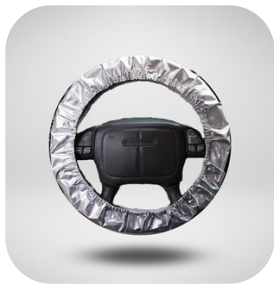
CUBRE VOLANTE VINIL PLATA 1 PIEZA